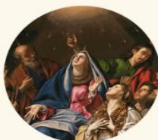
SOLEMNITY OF PENTECOST 5/28