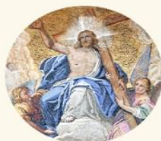
SOLEMNITY OF THE ASCENSION 5/21